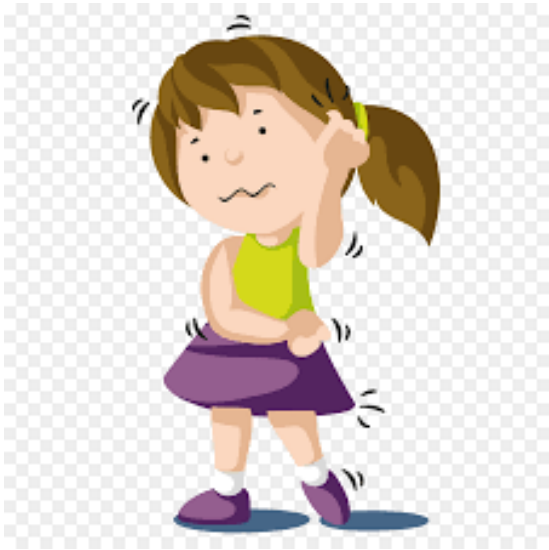
ယားယံခြင်း