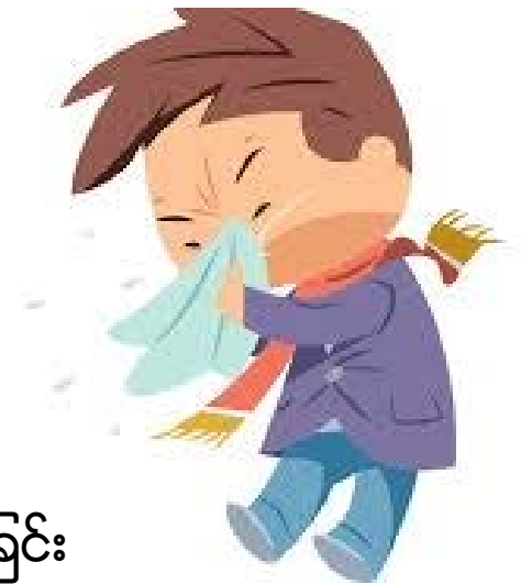
အသက်ရှူကြပ်ခြင်း