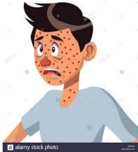
အနီကွက်ထွက်ခြင်း