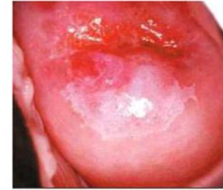
သားအိမ်ခေါင်းကင်ဆာ အစောပိုင်းအဆင့် (ရှုလကားရည် တို့အဖြစ်)