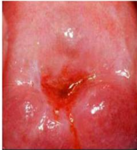
ကင်ဆာမပြန့်ပွား အကြိုအဆင့်ရှိနေသော သားအိမ်ခေါင်း (ရှုလကားရည် တို့အဖြစ်)