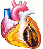
နှလုံးရောဂါ