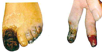
ခြေပုပ် ၊ လက်ပုပ်ရောဂါ

မွေးကင်းစနှင့်လသားကလေးငယ်များတွင် ■ အသက်ရှူလမ်းကြောင်းရောဂါများ၊ ■ ရင်ကြပ်ပန်းနာရောဂါ ■ နားပြည်ယိုခြင်း၊ မကြာခဏဖြစ်တတ်သည်။ ထို့ပြင်.... ရုတ်တရက်သေဆုံးခြင်းများ ဖြစ်နိုင်သည်။