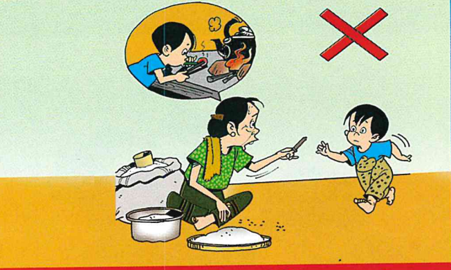
ကလေးငယ်များရှေ့တွင် ဆေးလိပ်သောက်ခြင်း ကလေးငယ်များအား ဆေးလိပ်မီးညှိခိုင်းခြင်းကို ရှောင်ကြဉ်ပါ။

မွေးကင်းစနှင့်လသားကလေးငယ်များတွင် ■ အသက်ရှူလမ်းကြောင်းရောဂါများ၊ ■ ရင်ကြပ်ပန်းနာရောဂါ ■ နားပြည်ယိုခြင်း၊ မကြာခဏဖြစ်တတ်သည်။ ထို့ပြင်.... ရုတ်တရက်သေဆုံးခြင်းများ ဖြစ်နိုင်သည်။