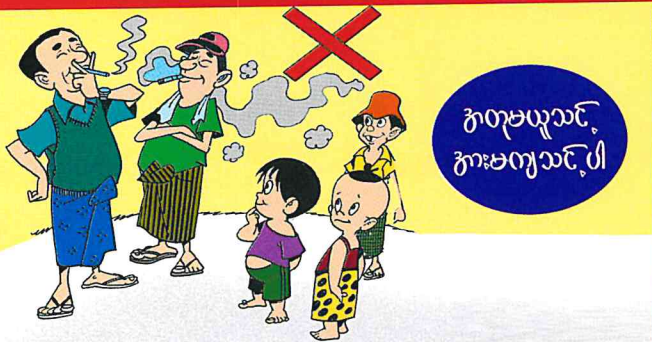
ဧကရာဇ်လူသား၊ ဧကရာဇ်လူသားပါ

လူကြီးများကို အတုခိုးသည့် အရွယ်တွင် အတုမြင် အတတ်သင် ဆိုသည့် အတိုင်း အသက်ငယ်ငယ်နှင့် ဆေးလိပ်စွဲသွားနိုင်သည်။ * ငယ်ရွယ်စဉ်စွဲသွားပါက ဖြတ်ရခက်သည်။ * ကျန်းမာရေးထိခိုက်မှုပိုများသည်။ * ရောဂါ ဖြစ်လွယ်သည်။ ဉာဏ်ရည်ထုံထိုင်းမည်။ * ဆေးလိပ်ကစ၍ မူးယစ်ဆေးဝါးသုံးစွဲရန် လမ်းစ ရနိုင်သည်။