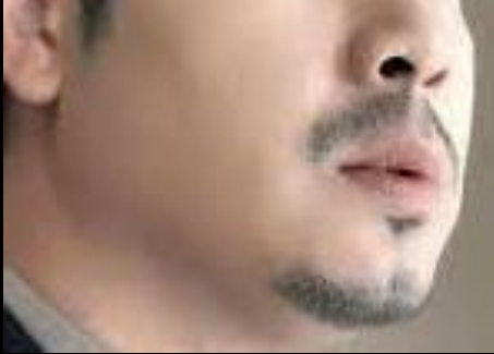
ကြည်လင်သန့်ရှင်းသည့်မျက်နှာ