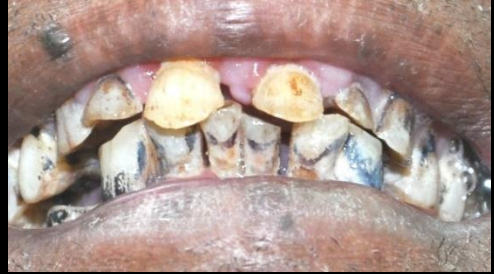
သွားပျက်စီးခြင်း