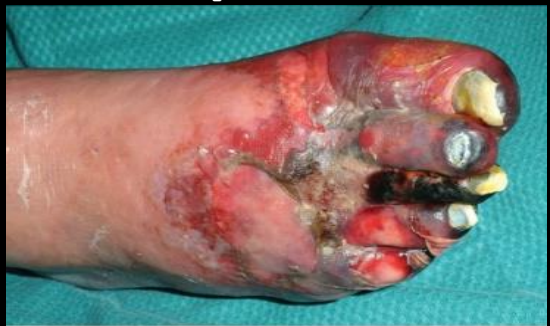
ခြေပုပ်လက်ပုပ်ရောဂါ