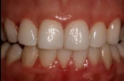
ကျန်းမာ၍အနံ့အသက်ကင်းသည့်ခံတွင်း