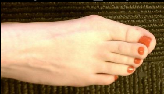
ရောဂါကင်းသည့်ခြေထောက်