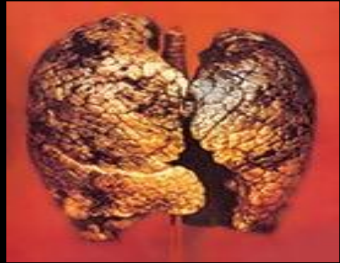
အဆုတ်ကင်ဆာ